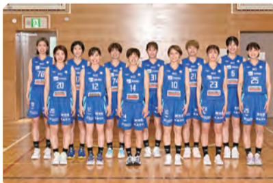
▲東京羽田ヴィッキーズ

日程：5月28日(日) 会場：水元総合スポーツセンター体育館 アリーナ 時間及び対象： 【1部】午前9時30分から午後0時30分(小学1～4年生) 【2部】午後1時30分から午後5時(小学5・6年生) 定員：1部・2部 合計180人