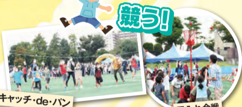
キャッチ・de・パン