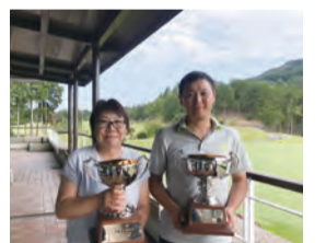
▲新ペリアの部優勝者