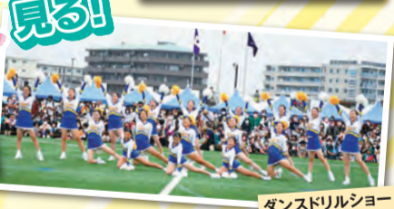
ダンスドリルショー