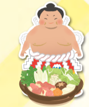
ちゃんこブースも開催!