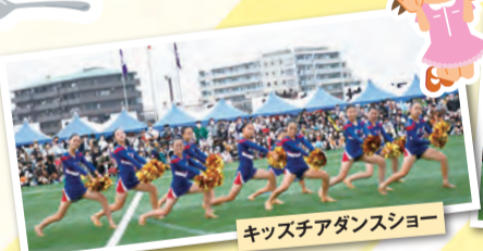
キッズチアダンスショー