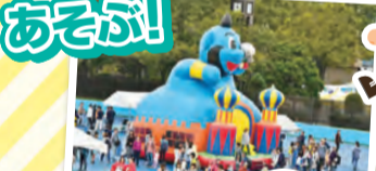
フワフワ無重力体験