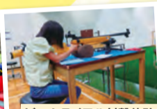
ビームライフル射撃体験